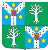
Facultatea de Biologie