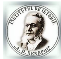
Institutul de Istorie „A.D. Xenopol” Iași