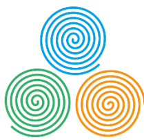
Institutul de Arheologie Iași